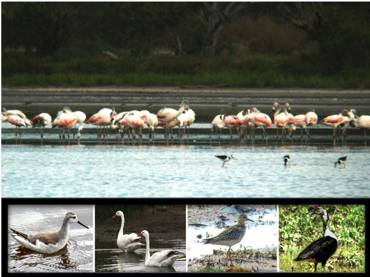
Foto: Phoenicopterus chilensis . Abajo Steganopus tricolor , Coscoroba coscoroba , Tryngites subruficollis , Sarkidiornis Melanotos © Silvia Centrón, Leticia López: Banco de Imágenes de Guyra Paraguay.

En Paraguay se identificaron 57 IBAs de las cuales 6 fueron declaradas bajo la categoría de congregaciones, criterios A4i por poseer el 1% de la población global de alguna especie de ave acuática y A4iii por ser áreas importantes para la concentración de aves acuáticas, éstos son: Río Negro – Pantanal (PY005) con el 1% de la población global de Jabiru mycteria y más de 20.000 individuos de aves acuáticas entre ellos cormoranes, cigüeñas y garzas (criterios A4i y A4iii); Laguna Ganzo (PY009) mantiene el 5% de la población global de Charadrius collaris (criterio A4i) junto a grandes cantidades de patos e ibises; Lagunas Saladas – Riacho Yacaré (PY010) califica como IBA de acuerdo a los criterios A4i y A4iii, debido a las grandes concentraciones de aves playeras migratorias, incluyendo un conteo de más de 20.000 individuos de Steganopus tricolor , la presencia de más de 1% de la población global del Casi Amenazado (NT) Phoenicopterus chilensis ;