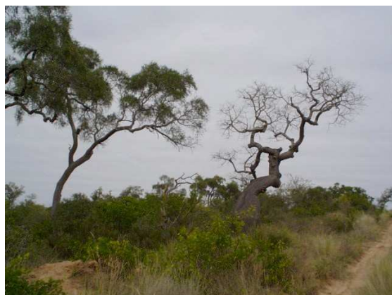
Reserva de Biosfera del Chaco - MaB