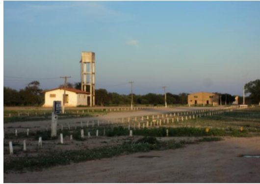
CASETA DE LA MOTOBOMBA, TANQUE DE AGUA Y AL FONDO EL HANGAR