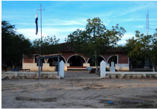
FACHADA PRINCIPAL DE LA COMANDANCIA Y OFICINA DE GUARDIA