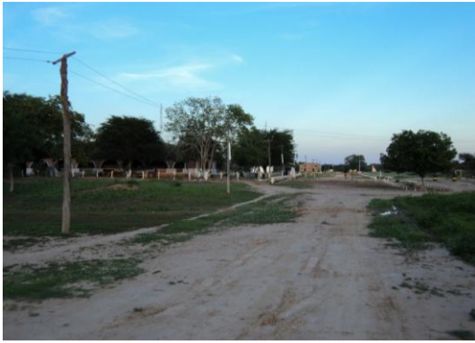
VISTA DE LA VIVIENDA PRINCIPAL, AL FONDO SE NOTA EL HANGAR