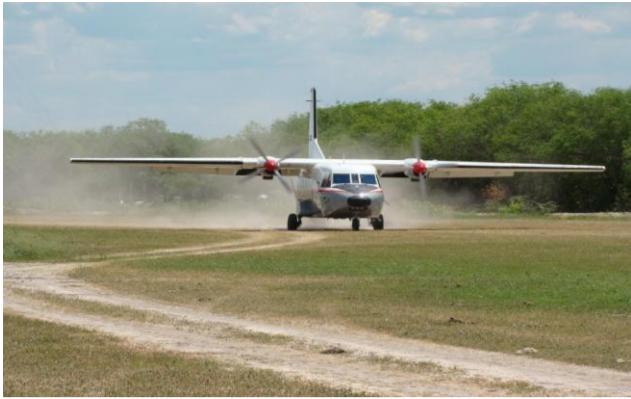
AVION ATERRIZANDO EN BAHIA NEGRA