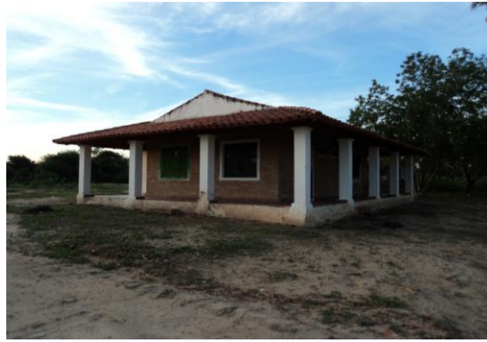
VISTA DE LA VIVIENDA Y OFICINA DEL SEGUNDO COMANDANTE